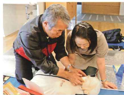
▲救命講習では、等身大の人形を使って、心臓マッサージなどを実践的に訓練

アウルでは入居者様の安心、安全を守るために、毎年1回職員が普通救命講習を受講し、心肺蘇生法や止血法、AED(自動体外式除細動器)の使い方などを学んでいます。また、火災を想定した消防訓練は年