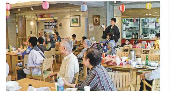
▲出し物で賑やかなレストラン。飾り付けも彩りを添え、お祭りムード満点