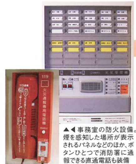
▲事務室の防火設備。煙を感知した場所が表示されるパネルなどのほか、ボタンひとつで消防署に通報できる直通電話も装備

入居者様の搬送では、毎回マットレスが活躍します。全居室のベッドに備えられたこのマットレスには、寝ている方を固定するベルト2本が両脇に、運ぶ人が持つ取手が四方に付いており、寝た状態のまま搬送することができるすぐれたものです。