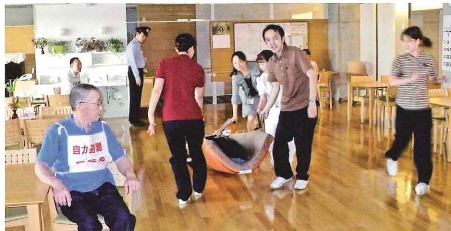
▲避難場所のレストランまで、入居者様役をマットレスで搬送

いざというとき最良の判断を瞬時に行えるようになるには、予行練習を何度も繰り返して感覚を鍛え、不測の事態に際しても自然と体や頭が動くよう訓練することが大切です。アウルのような何十名もの入居者