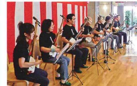
▲ボランティア「つくしの会」の皆さんによる津軽三味線の演奏