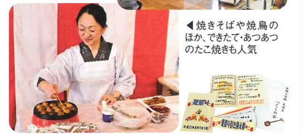
◀焼きそばや焼鳥のほか、できたて・あつあつなたこ焼きも人気