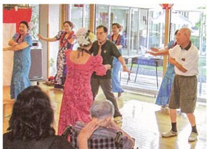
▲フラダンスにご入居者様も参加