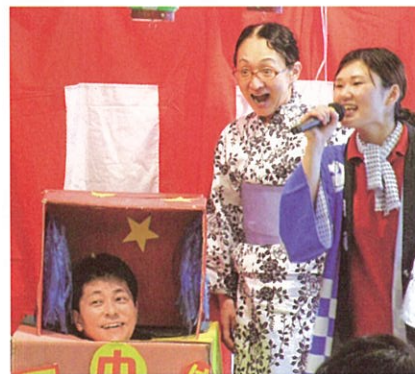
▲武田施設長のお題は、なんと代表