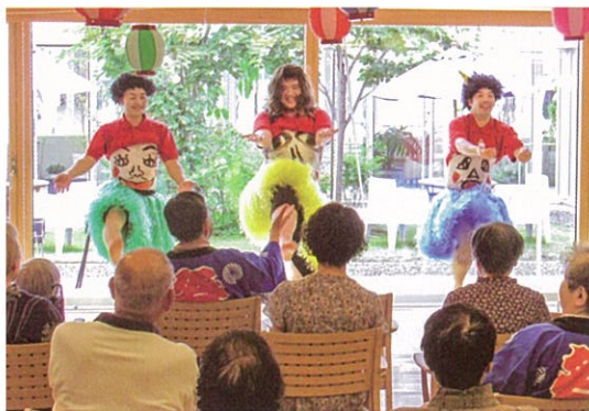
▲会場を沸かせた安来節ブラザーズ