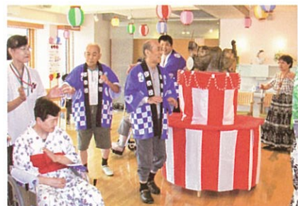
▲車いすの方も一緒に盆踊り