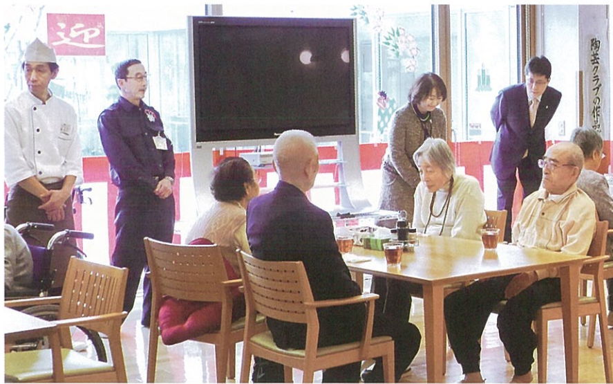
▲元日に職員から入居者様へ新年のごあいさつ

大晦日は、お正月飾りに彩られた館内で、年越し御膳のおそばを食べ、ゆず湯につかり、新年を迎える準備は万端。明けて元日の昼食は、いつもよりおめかしした装いで皆さんがレストランに集われました。御神酒やノンアルコールのシャンパンで乾杯し、お正月らしい料理に舌鼓を打ちました。神社でいただいたおみくじをお配りし、B.G.Mは琴が奏でる「春の海」。お正月気分は満点です。