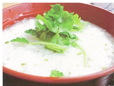
▲やさしい味わいの七草がゆ

ほとんどの入居者様がアウルでまったりのんびりと過ごされた今年のお正月。皆さんの家として、アウルが居心地のよい場所になれていることが、うれしく感じられた年の初めでした。