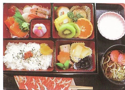
▲大晦日の夕食は、おそばの付いた年越し御膳

三が日以降も新年のいい行事は続きました。7日(月)には七草がゆで無病息災を願いながら、おせちに疲れた胃腸をね