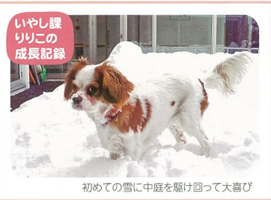
いやし課 りりこの 成長記録